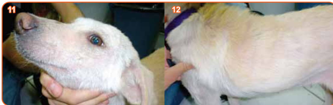
Fotos 11 y 12. Muestra la mejoría de la paciente, presencia de pelo y ausencia completa de las lesiones que presentaba. 06/11/10.