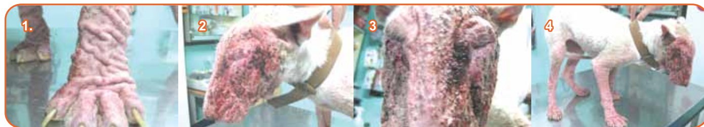
Foto 1. Miembro anterior izquierdo, se observa hiperqueratosis y alopecia grave difusa. 24/09/10.

Ingres a la clínica veterinaria, una perra de Raza Bullterrier, adulta, con lesiones muy graves en la piel como se muestran a continuación: