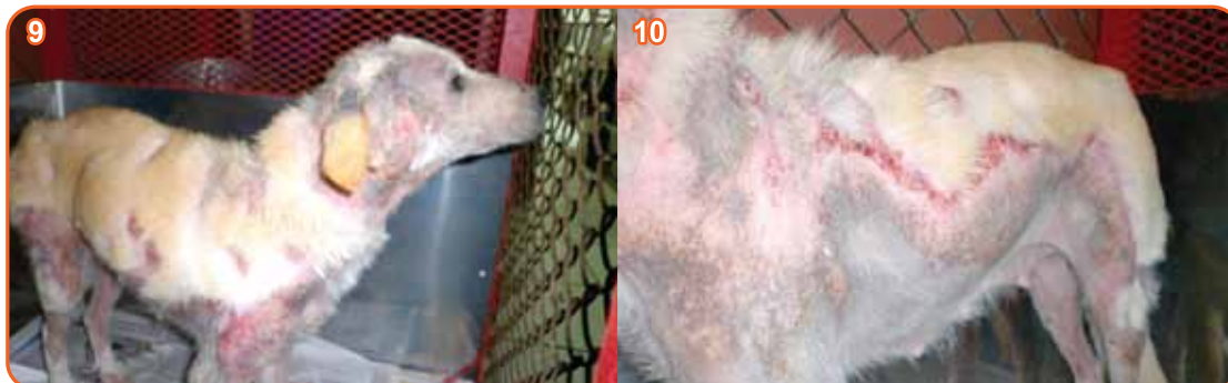
Fotos 9 y 10. Muestran las lesiones tan severas de la perra, en donde se observan úlceras en piel y caída de pelo. 08/09/10.

Ingresa a la clínica veterinaria una hembra canina proveniente de la calle, se instaura una terapia a base de antibiótico (cefalexina), Immunol® jarabe 4 ml cada 12 horas, Regurin® jarabe 4 ml cada 12 horas y baños semanales con Erina® Shampoo , durante 2 meses. A continuación se muestra en fotografías el estado en que se encontraba cuando se inició con el tratamiento y su mejoría: